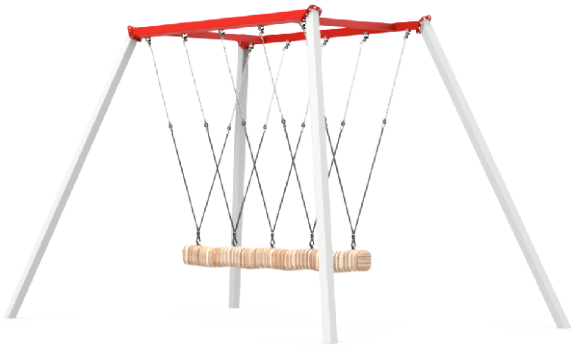
Rysunek poglądowy. W zależności od wybranej opcji, urządzenie może się nieznacznie różnić