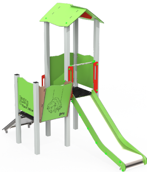
Rysunek poglądowy. W zależności od wybranej opcji, urządzenie może się nieznacznie różnić