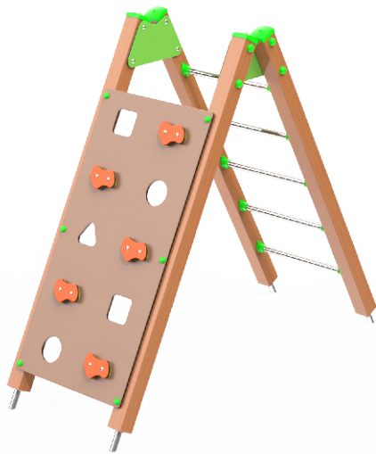
Rysunek poglądowy. W zależności od wybranej opcji, urządzenie może się nieznacznie różnić