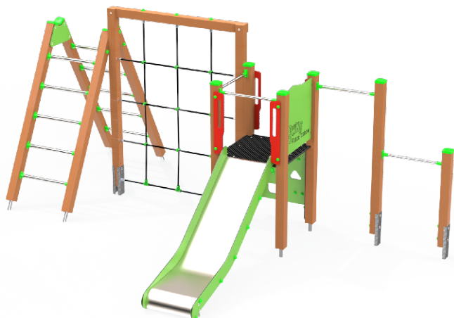
Rysunek poglądowy. W zależności od wybranej opcji, urządzenie może się nieznacznie różnić